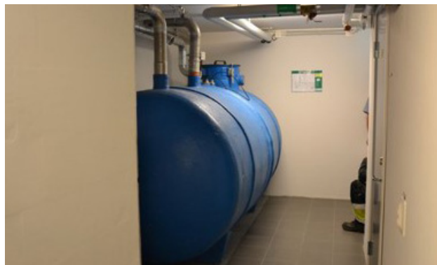
Lagringstank i armerad glasfiber.