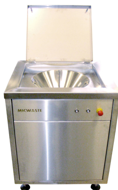
Inkastbänk i rostfritt stål