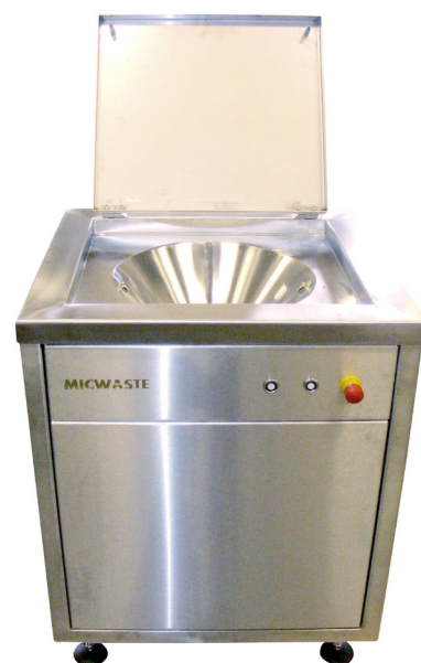
Inkastbänk i rostfritt stål