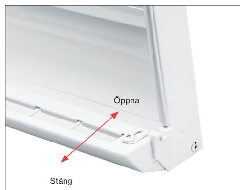
Spjället regleras enkelt med fingertopparna. Bilden visar spjället i öppet läge

Easy-Vent kan kompletteras med spjäll i efterhand. Det beställs från Acticon och monteras enkelt med hjälp av medföljande skruv och plastbricka.