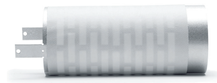
CV 80 i perforerad aluzinkplåt med fibersäker och vattentät skyddsväv. Kanalen är försedd med fästbleck. Diameter Ø80 mm. Håltagning: Ø85 mm

Kontakta Acticon om ni önskar information om aktuella anpassningstermer.