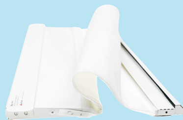
Böjbara Flexi monteras enkelt bakom element

Luftdonet Flexi placeras bakom elementet (radiatorn) i övriga utrymmen såsom vardagsrum och sovrum. Här tillförs ny luft som är filtrerad och förvärmad. Den friska luften strömmar genom bostaden och fångar upp föroreningar på sin väg till spiskåpa och frånluftsvan­tiler.