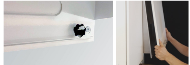
Lossa mutternattarna och haka av fronten