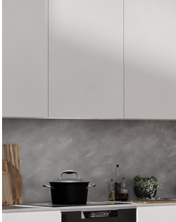
Kåpa - stängt läge