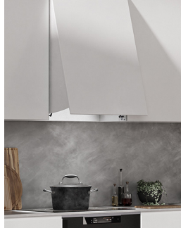
Kåpa - öppet läge

Öppna volymkåpan genom att ta i kåpans underkant eller handtag och dra utåt.