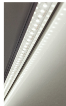
LED-belysning längs hela volymkåpans bredd.