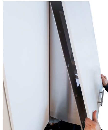
Enkelt att lyfta av fronthuv.

Redovisade flödesvärden uppmätt hos SP enligt standard EN 13141-3:2017 med kåpan monterad 500 mm över spishäll.