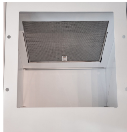
Fettfiltret placeras diagonalt i skåpkåpans överdel.

Anslutningsstos storlek 125 mm som standard.