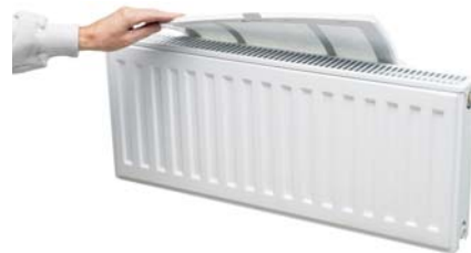
Filtret är böjbart vilket gör filterbytet enkelt även vid lågt placerad fönsterbänk