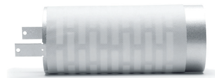
CV 80 i perforerad aluzinkplåt med fibersäker och vattentät skyddsväv. Kanalen är försedd med fästbleck. Diameter Ø80 mm. Håltagning: Ø85 mm

Kontakta Acticon om ni önskar information om aktuella anpassningstermer.