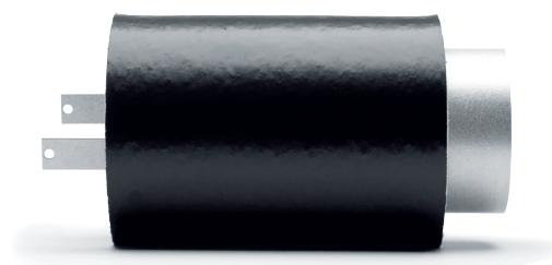
CI 100 med utvändigt ljudisoleringslag och fästbleck. Invändig diameter/utvändigt diameter: Ø100/140 mm. Håltagning: Ø145 mm från insida vägg och Ø105 mm genom den yttre delen av fasaden.