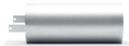
CS 100 i slätplåt med fästbleck för fixering i vägg. Diameter Ø100 mm. Håltagning: Ø105 mm