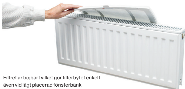
Filtret är böjbart vilket gör filterbytet enkelt även vid lågt placerad fönsterbänk