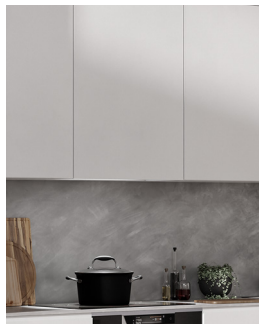
Emhætte - lukket position