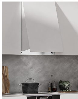
Emhætte - åben position

Åbn emhætten ved at tage fat i hættens underkant eller håndtag og trække udad.